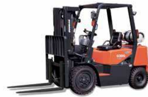
G20G / G25G / G30G 2 000kg 2 500kg 3 000kg LPG, pneumatische banden