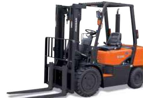
D20G / D25G / D30G 2 000kg 2 500kg 3 000kg Diesel, pneumatische banden